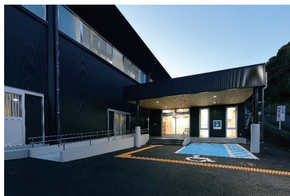
外観(ピロティ 夜景)