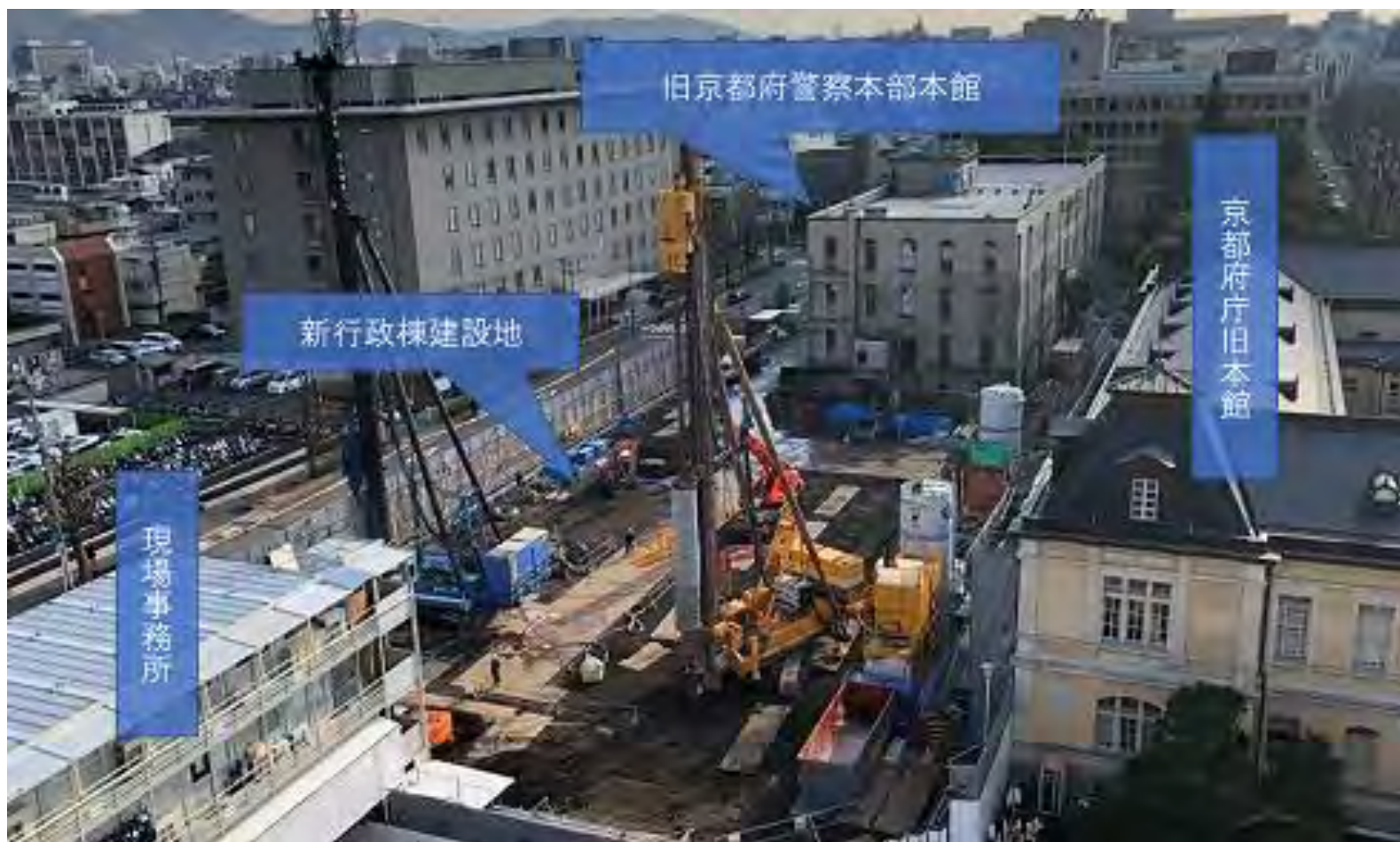
山留め工事（令和3年1月13日撮影）