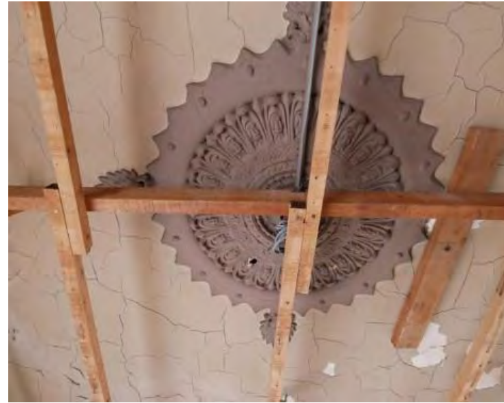
今回現れた 天井中心飾り