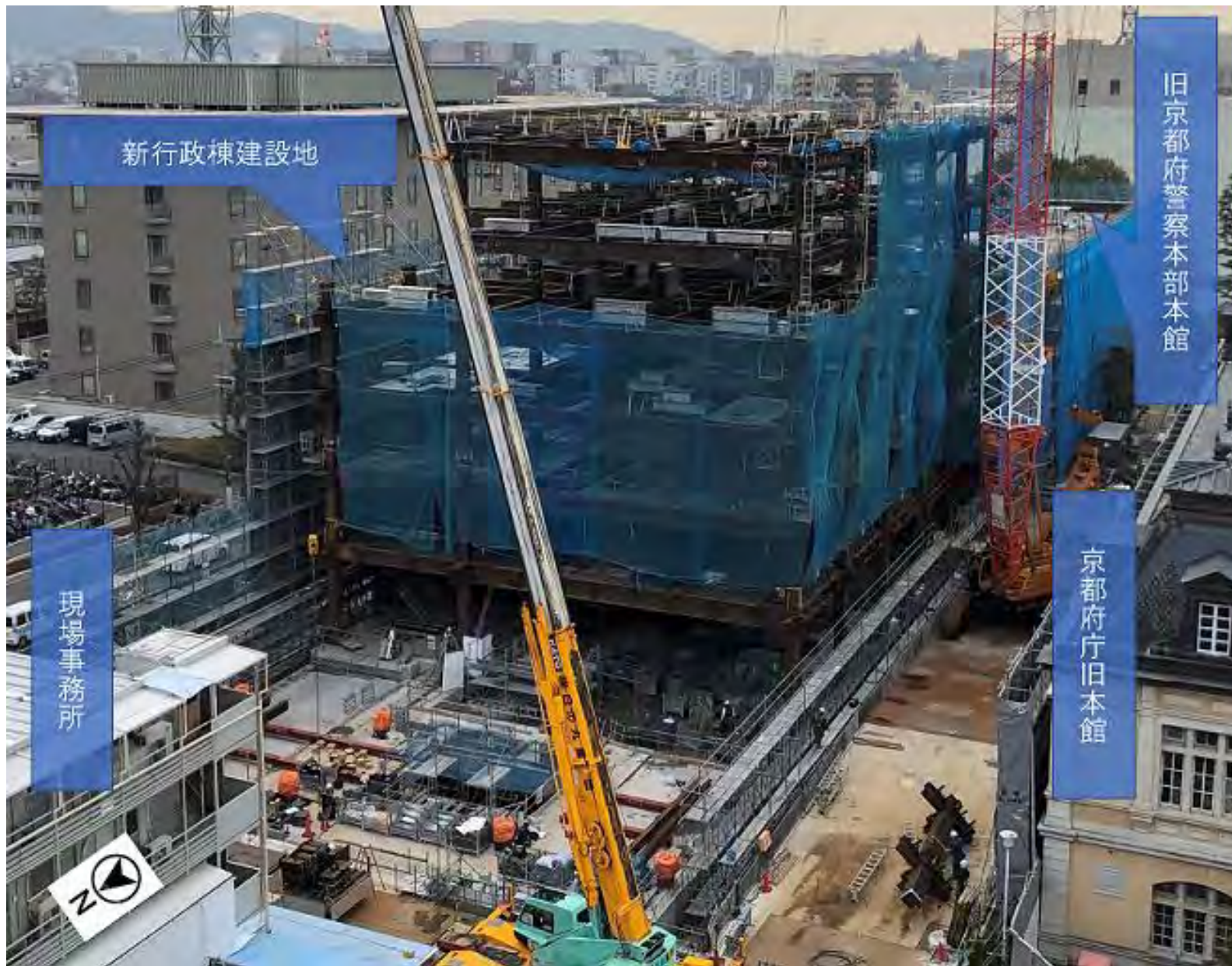
(新行政棟中央部西側) 6階部分を組立中 (令和4年2月15日撮影)