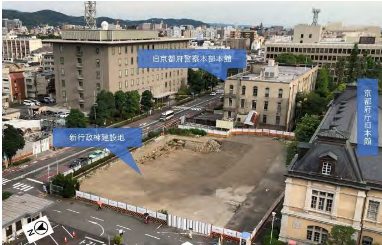
工事前の状況（令和2年6月17日撮影）