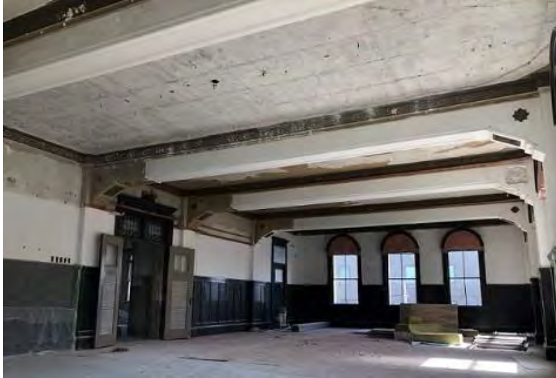
内装撤去後の様子