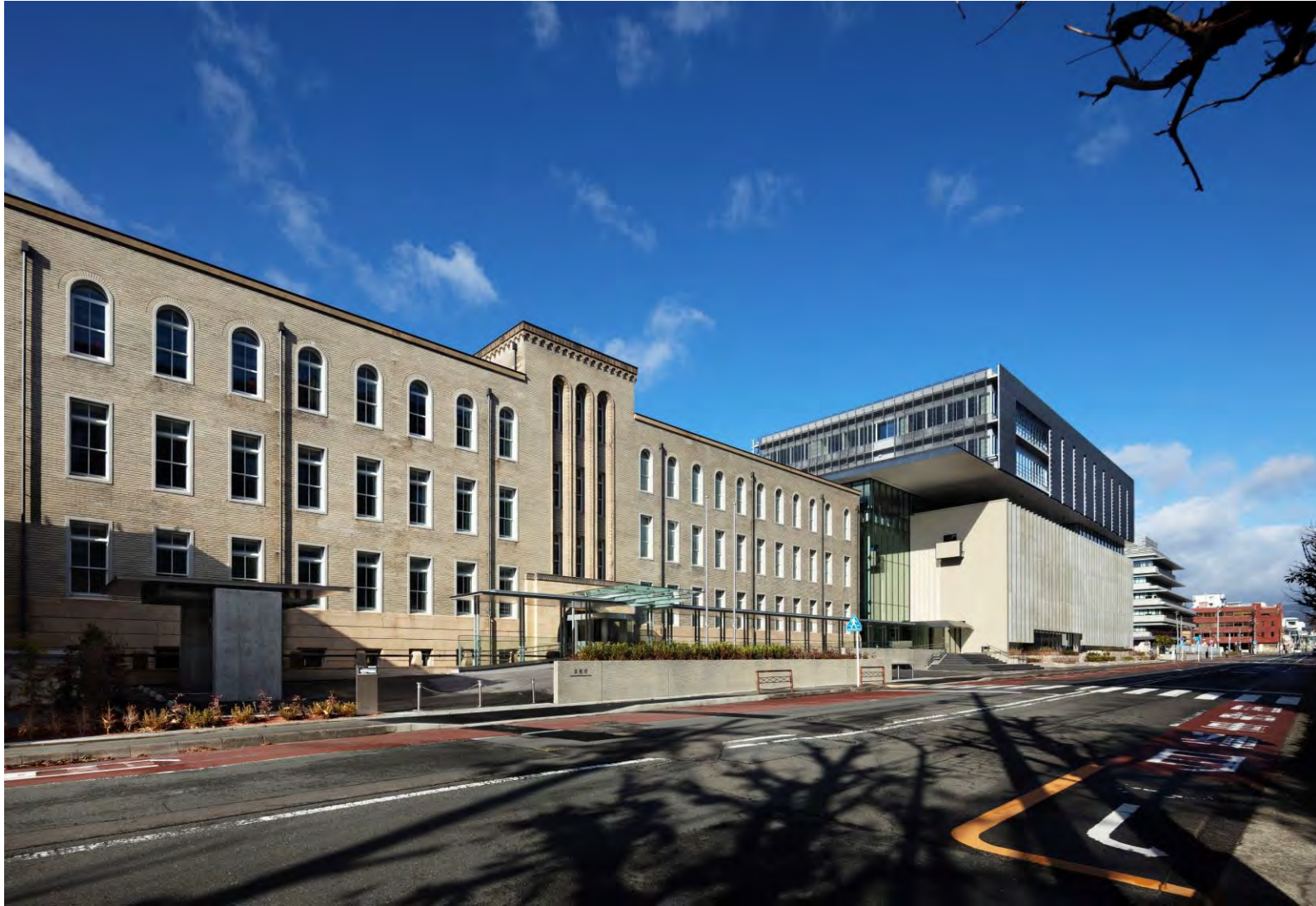
新町通からのぞむ