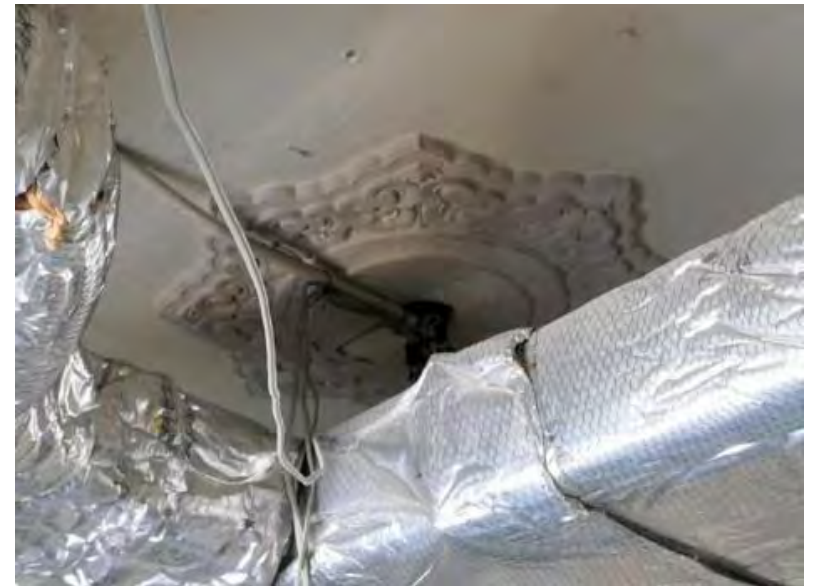
京都府HP：新行政棟・文化庁移転整備工事より