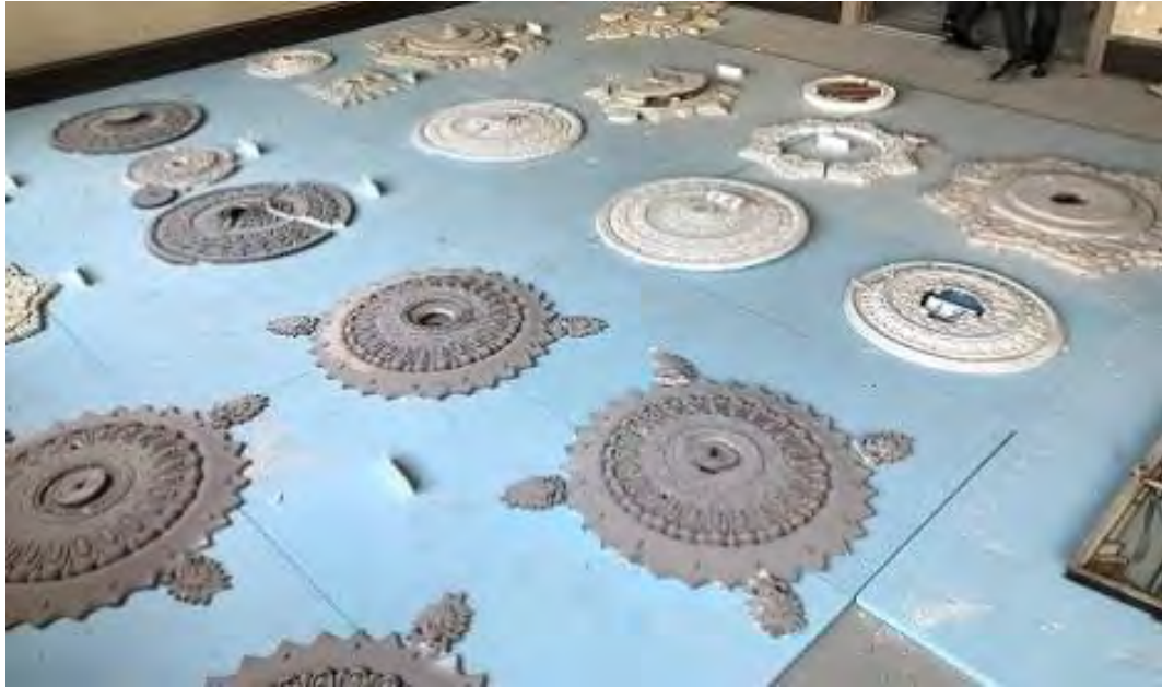
生かし取りした天井中心飾り