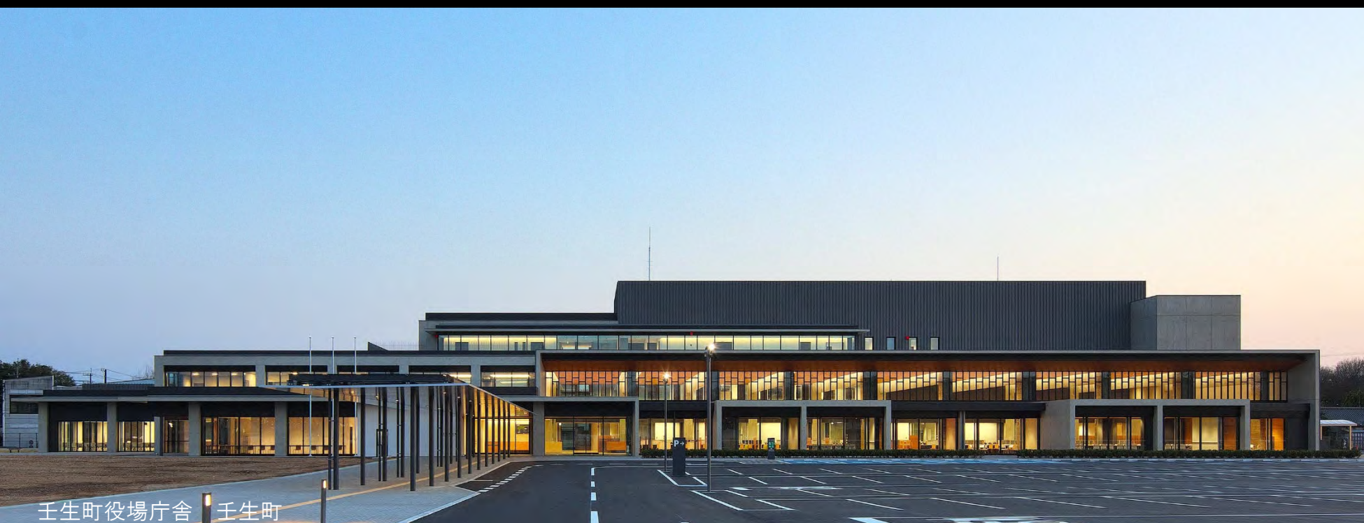
壬生町役場庁舎 壬生町