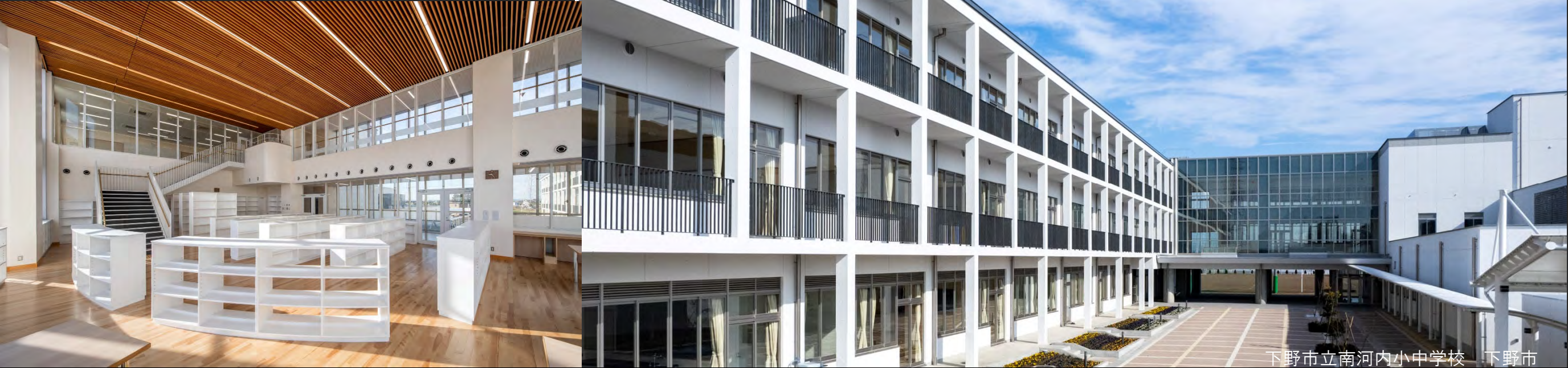
下野市立南河内小中学校 下野市