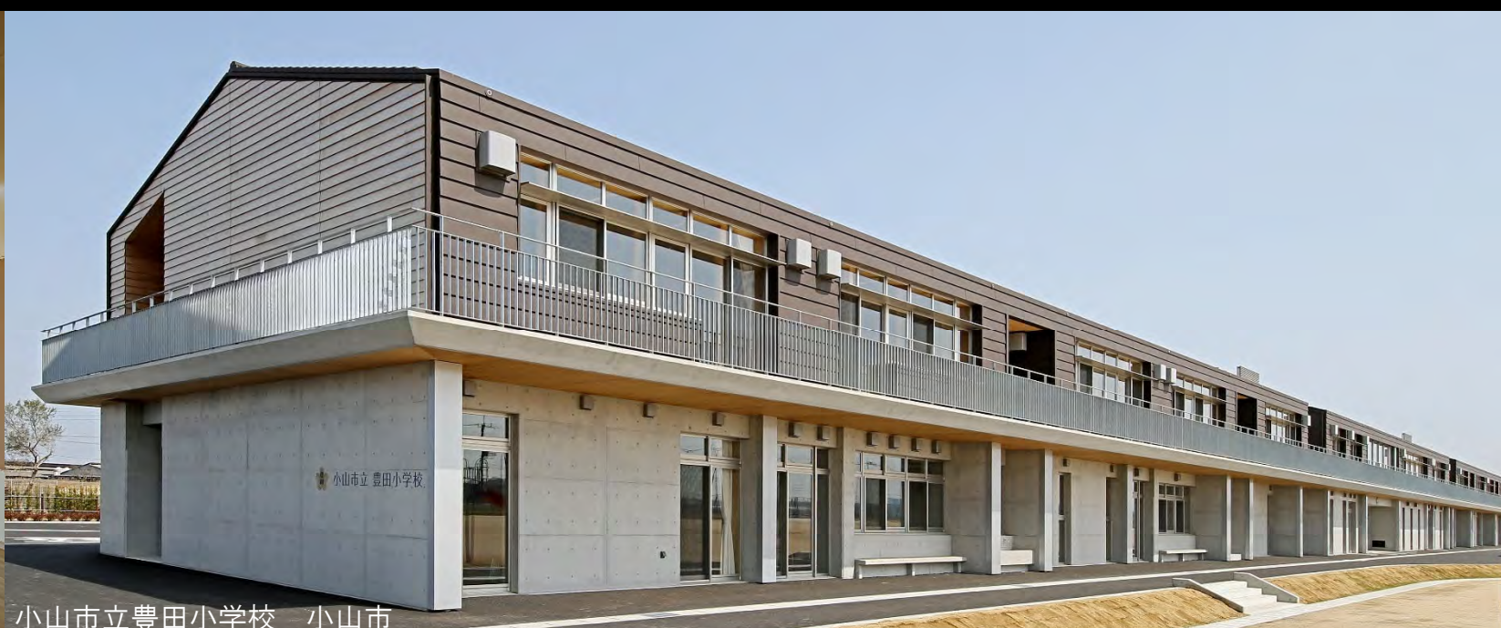
小山市立豊田小学校 小山市