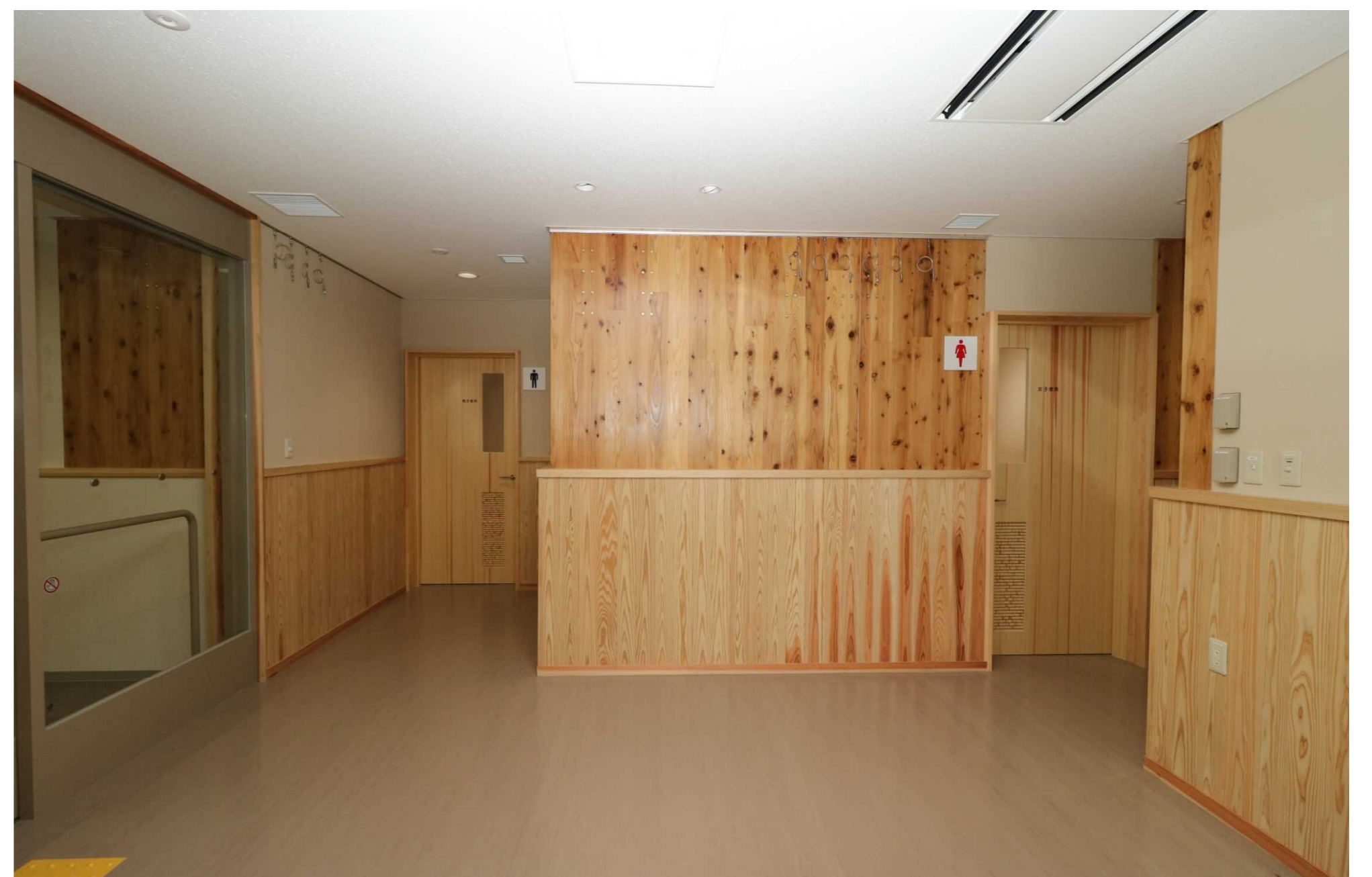
〔積極的に木材活用した玄関ホール〕