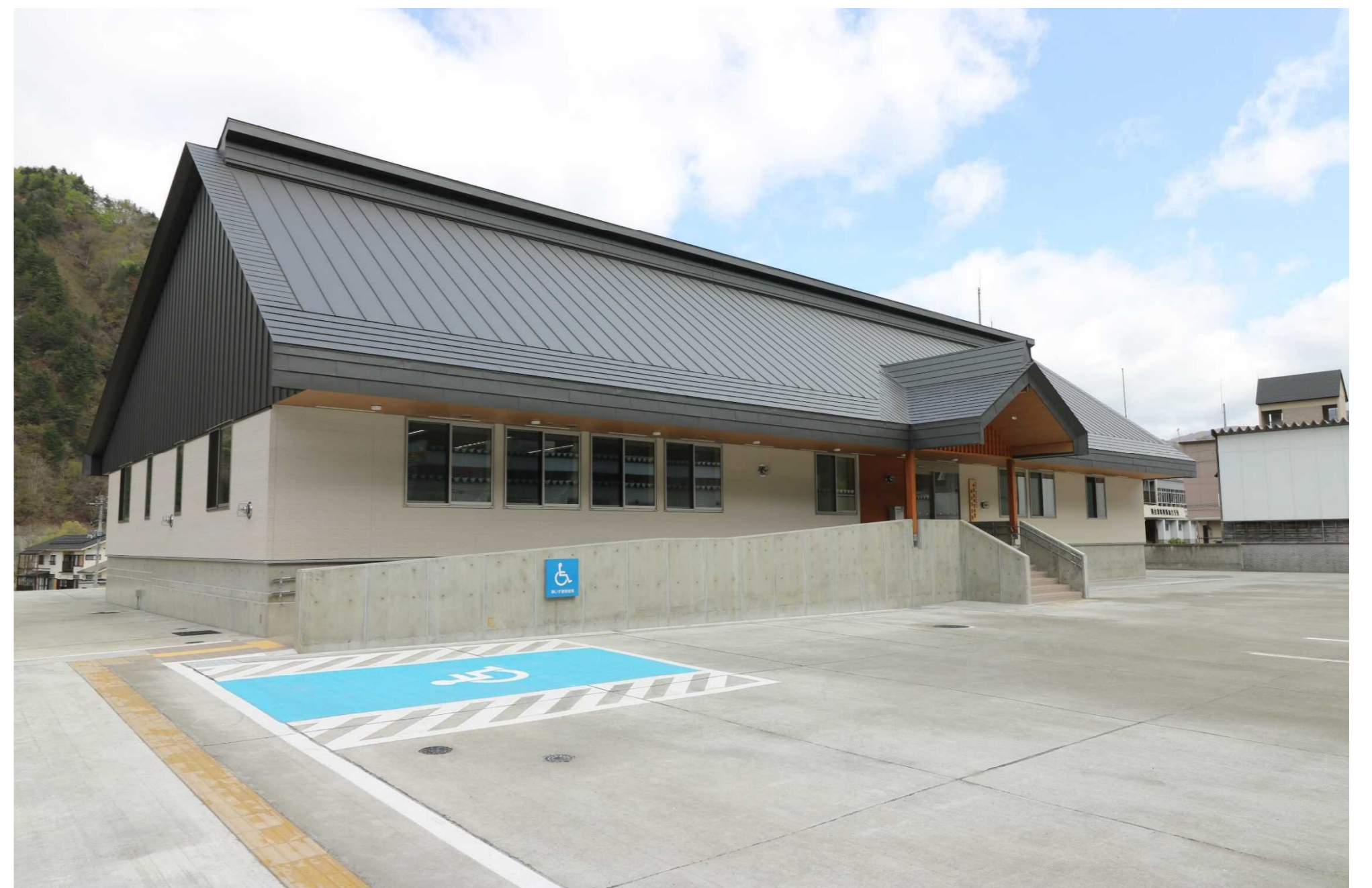
〔南西側から庁舎を望む〕