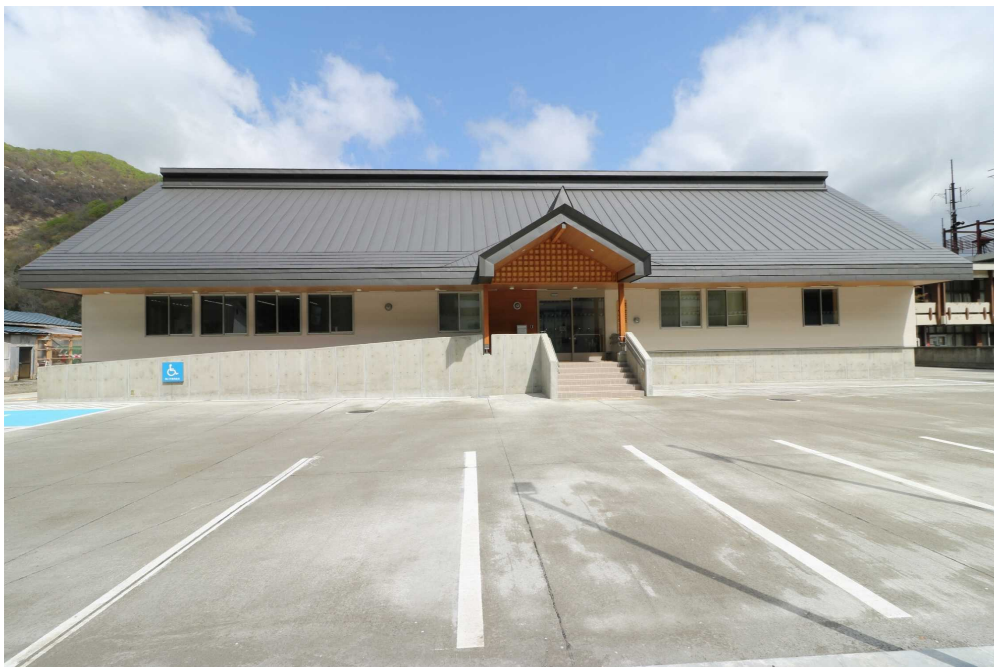
〔南側から庁舎を望む〕

屋根は「への字形」の落雪屋根を採用し、主として北側の堆積スペースへ落とす計画とするなど、多雪地域における保全性に配慮した設計を行っています。