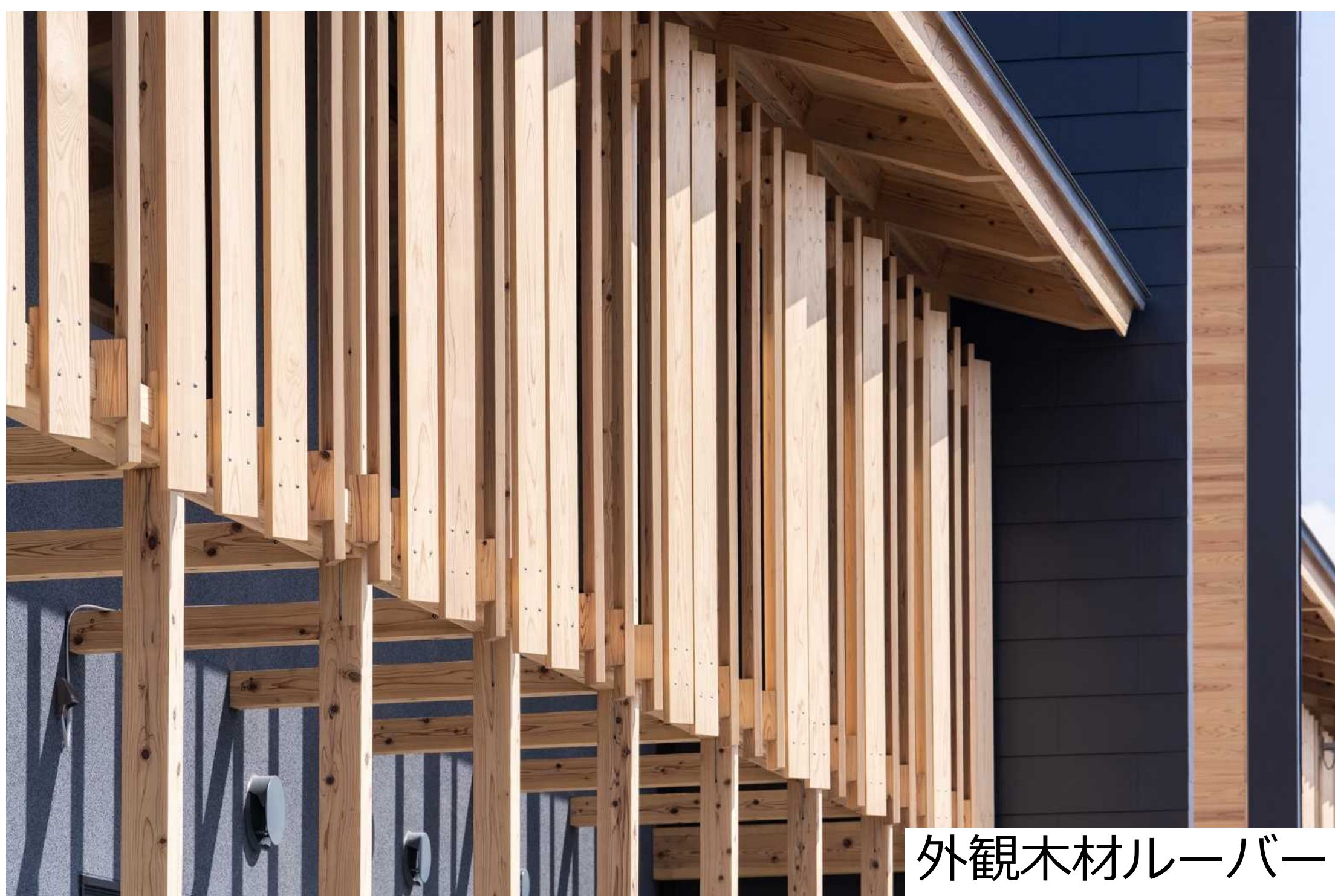
外観木材ルーバー