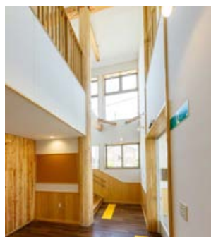
【CLT材・ヒバ丸太柱を使用した1階ホール】