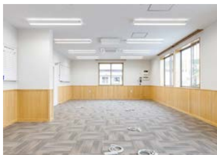
【壁仕上げ材に木材を利用した1階事務室】