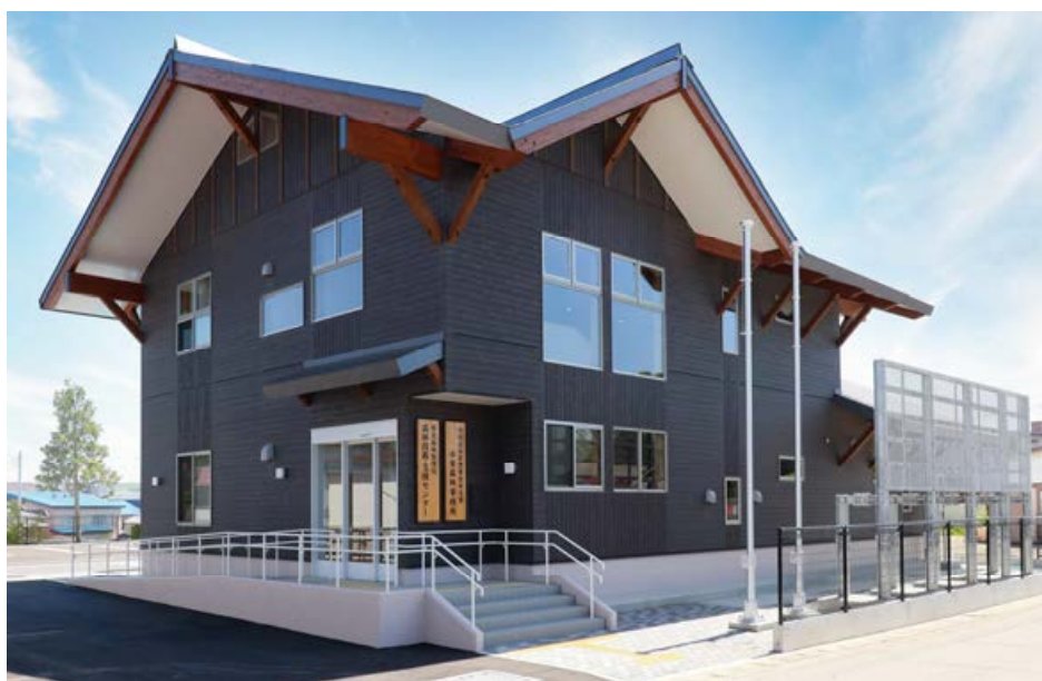
【地域の景観を考慮した北側外観】

事務室・廊下などの壁面仕上げ材に木材を使用し、1階ホール・階段においてCLTパネル（直交集成材）やヒバ丸太柱を使用することで、国の施策として木材利用の推進に取り組んでいます。