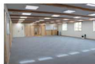
【フレキシブル仕向を考慮した事務室空間】