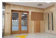
【木の香りで出迎える玄関ホール】