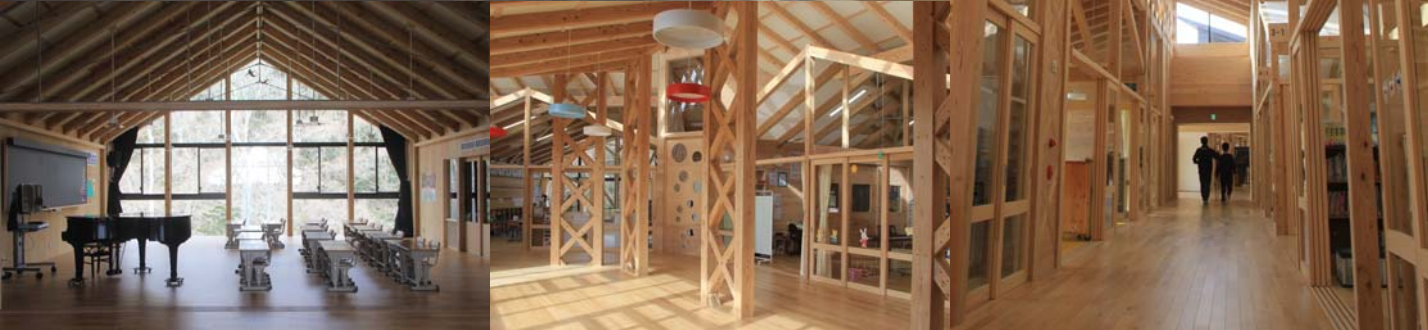
東松島市立宮野森小学校 (東松島市)

見学施設 オーエンス泉岳自然ふれあい館 (仙台市泉区) 東松島市立宮野森小学校 (東松島市)