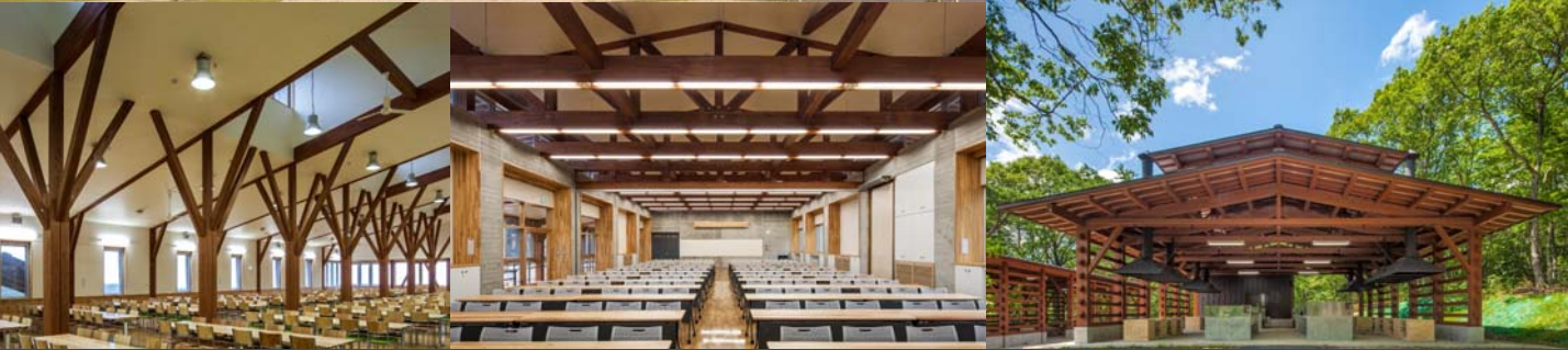
オーエンス泉岳自然ふれあい館 (仙台市泉区)