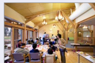
生活棟ダイニング

既存施設の改築にあたり、肢体不自由などの障害を持つ子どもたちが障害を乗り越え、やがて社会に羽ばたいていく場となることを目指し、「施設は、真に子供たち本位に運営されているか」という施設運営責任者の根源的な問いかけを出発点に、責任者の強い情熱の下で、多くの関係者の英知を結集し、入所の子どもたちの生活の場所に看護スタッフが常に寄り添ってケアをする、ユニットケアというわが国では極めて例の少ない施設理念の下に新たな施設整備が行われている。入所の子どもたちは長い間病棟で暮らし、やがて地域や家庭に帰らなければならない。その両面が快適に実現されるように、建築計画では施設全体を「まち」「みち」「いえ」に見立てるコンセプトが採用され、各機能は分棟化・分散配置された。20床のユニットケアの2棟については、極力、家庭的な形態・仕様とされており、施設運営の理念が設計、施工面でも見事に実現されている。スタッフの施設理念の実現への努力、さらなる発展・改善に努めた結果、子どもたちの状況に大きな改善が認められるようになってきていることなどが評価された。