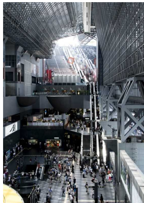
「提供: 原広司+アトリエ・ファイ建築研究所」